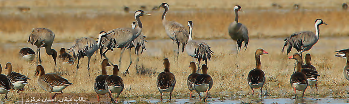
تالاب میغان، استان مرکزی Meighan Wetland, Markazi

Inland wetlands act as a natural sponge, absorbing and storing excess rainfall and reducing flooding.